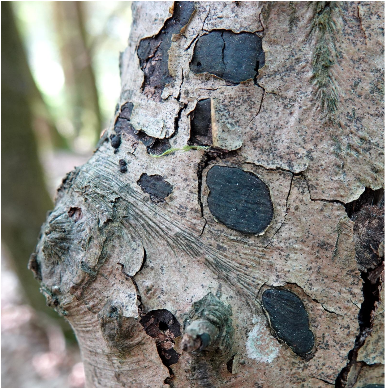
Biscogniauxia nummularia (Bull.) Kuntze, 1891 - Xylariales - Xylariaceae