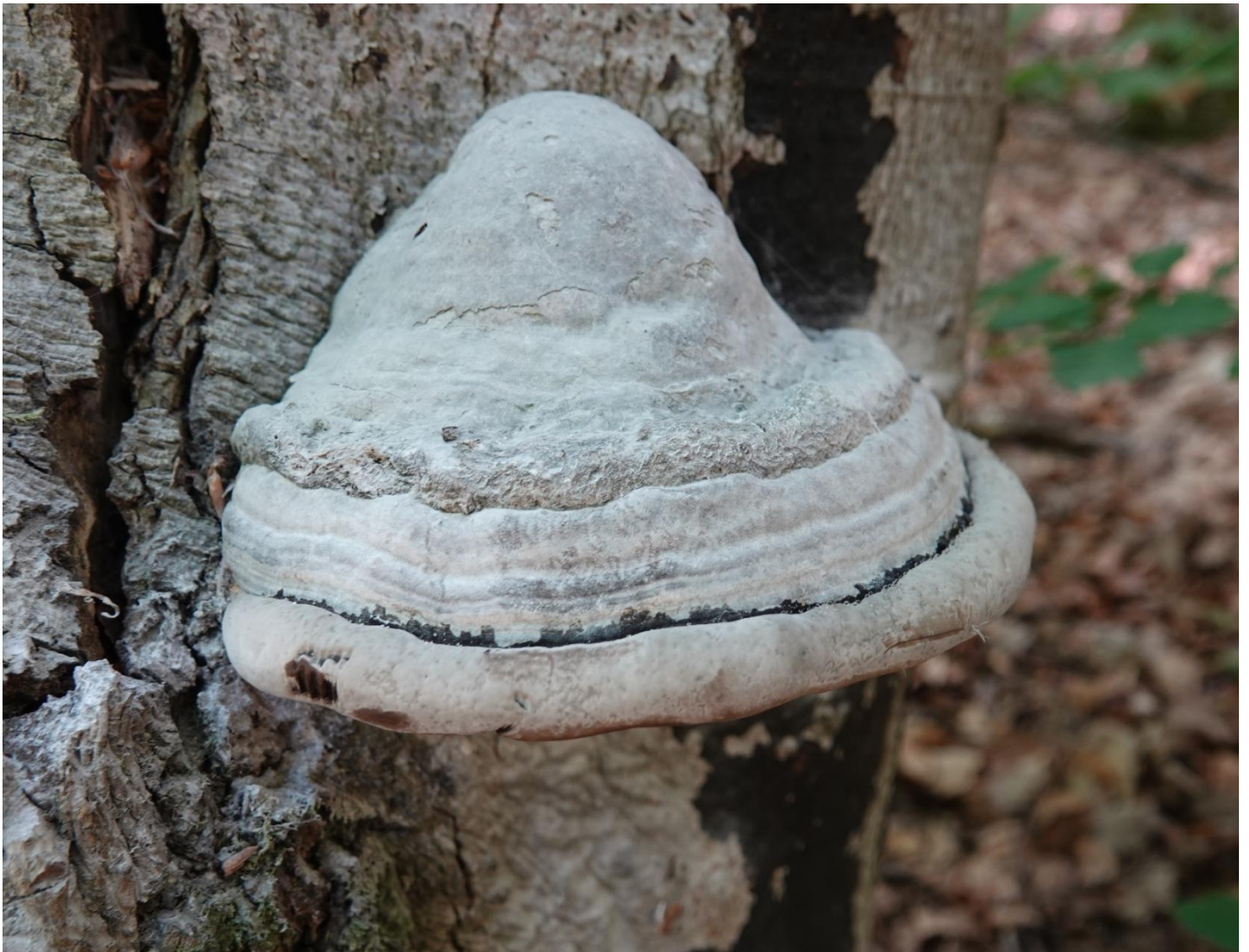
Fomes fomentarius (L.) Fr., 1849 Amadouvier - Polypore allume-feu - Polyporales - Polyporaceae