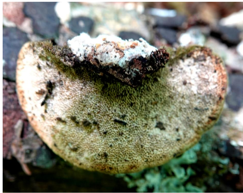
Trametes hirsuta (Wulfen) Pilát, 1939 Tramète hirsute - Polyporales - Polyporaceae