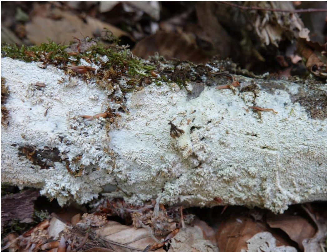
Schizopora paradoxa (Schrad.) Donk, 1967 Hymenochaetales - Schizoporaceae