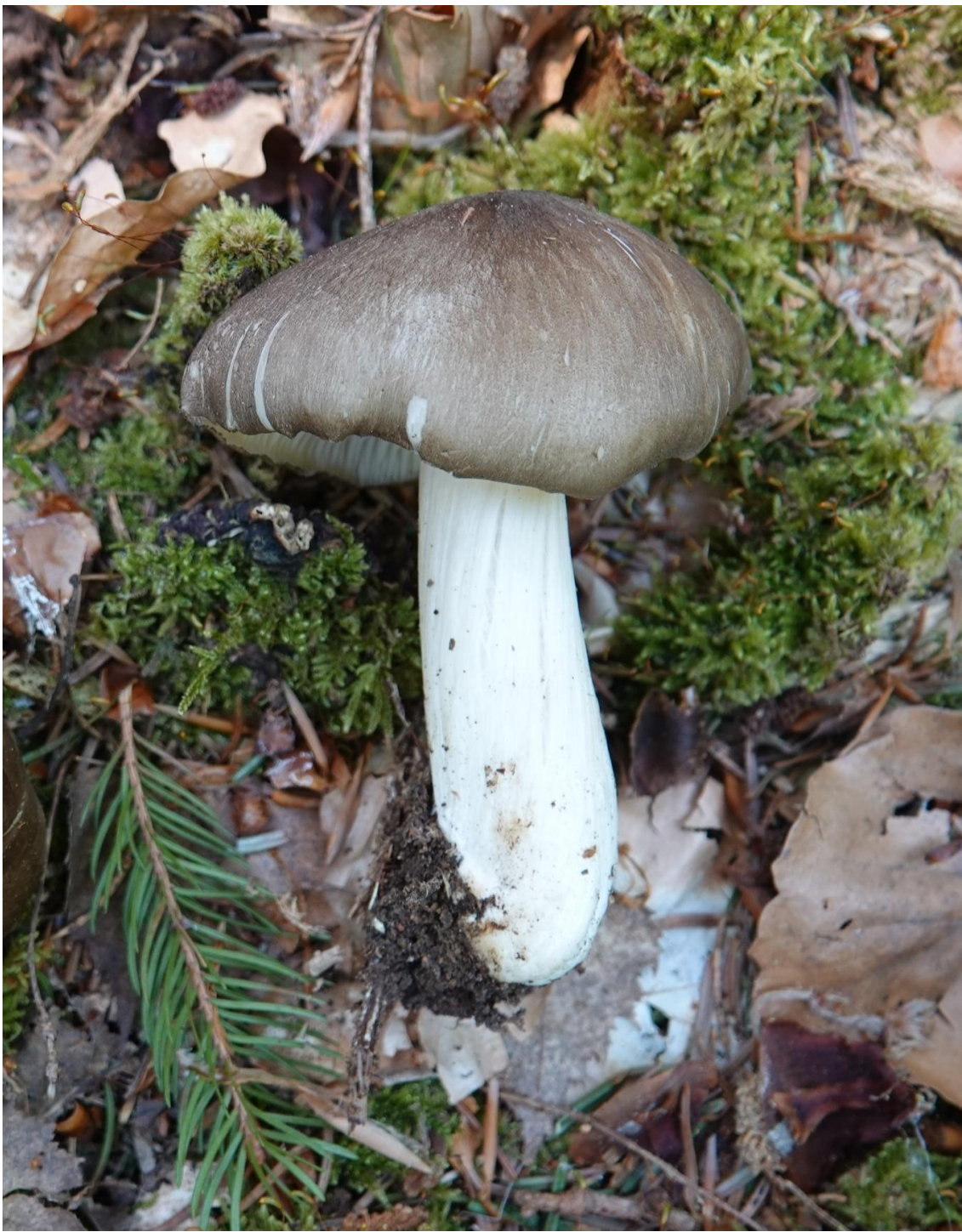
Megacollybia platyphylla (Pers.) Kotl. & Pouzar, 1972 Collybie à lames larges - Tricholomatales - Mycenaceae