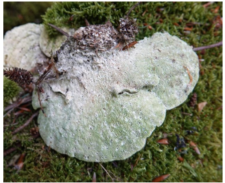
Trametes gibbosa (Pers.) Fr., 1838 Tramète bossue - Polyporales - Polyporaceae