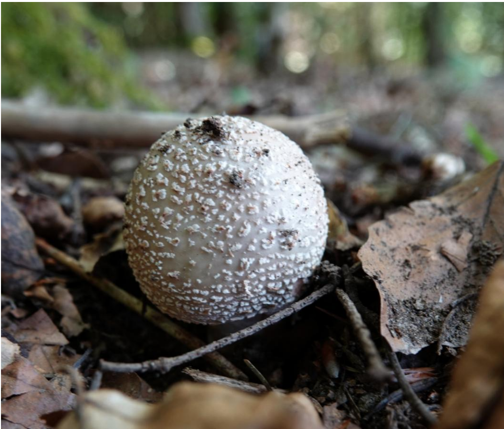
Amanita rubescens Pers., 1797 Amanite rougissante - Oronge vineuse - Amanitales - Amanitaceae