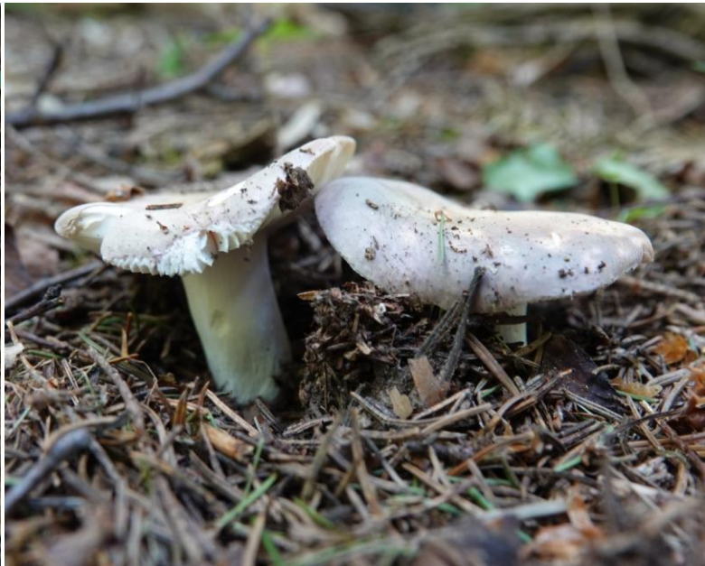
Russula cyanoxantha (Schaeff.) Fr., 1863 Russule charbonnière - Russulales - Russulaceae