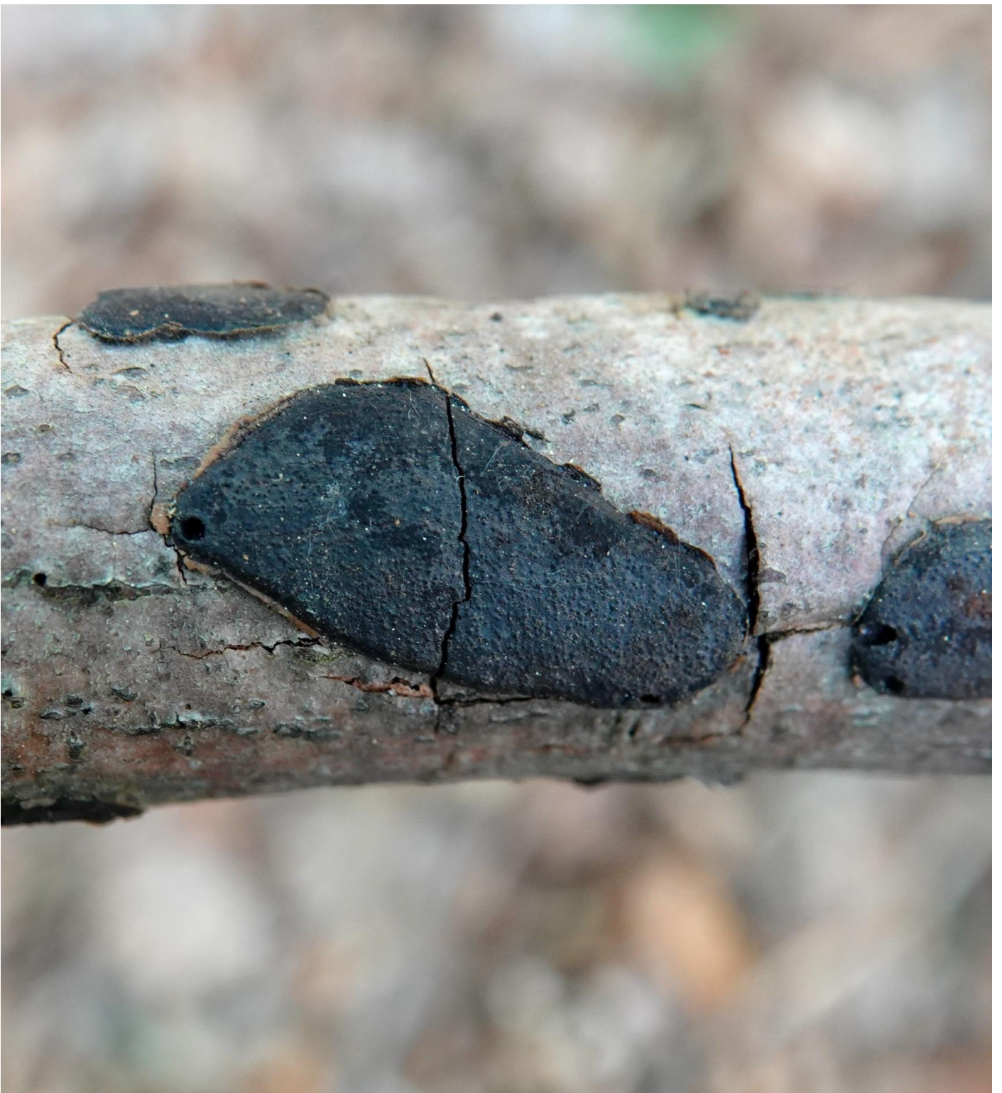
Biscogniauxia nummularia (Bull.) Kuntze, 1891 - Xylariales - Xylariaceae