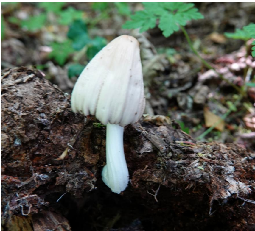
Coprinellus domesticus (Bolton) Vilgalys, Hopple & Jacq. Johnson, 2001 Coprin domestique - Agaricales - Psathyrellaceae