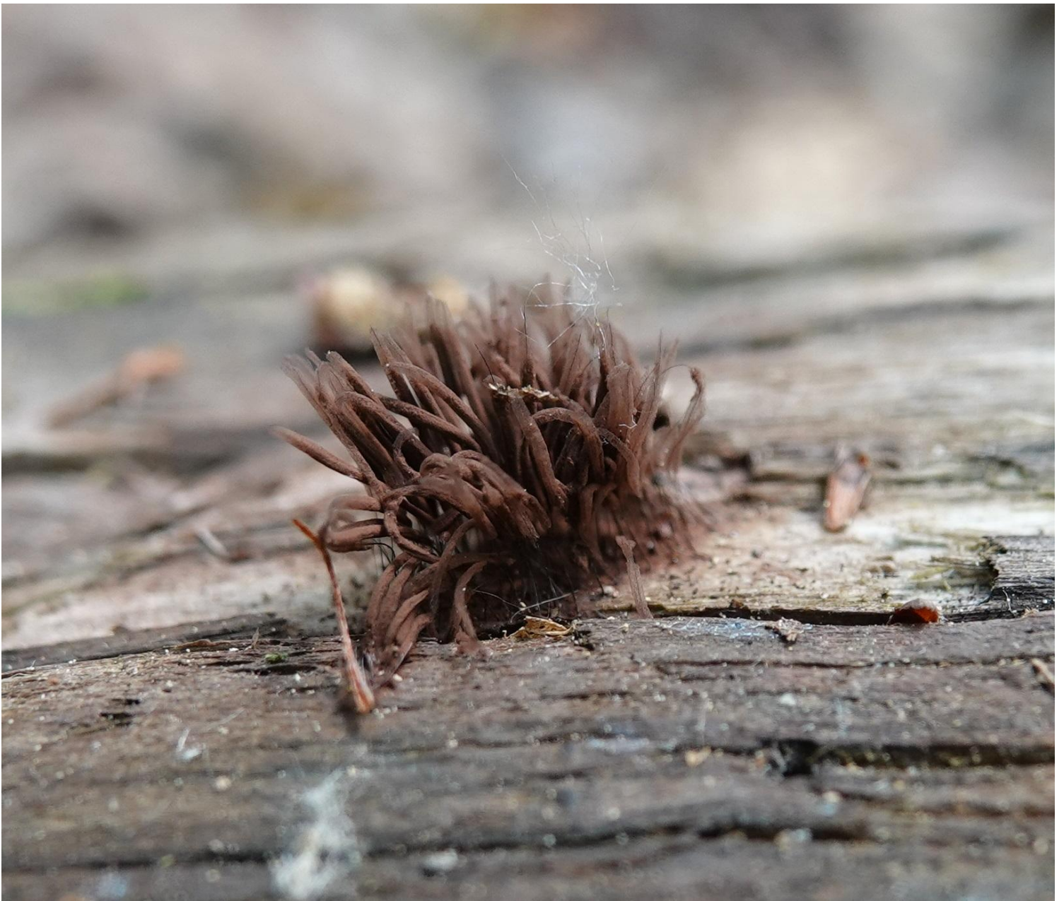
Stemonitis axifera (Bull.) T. Macbr., 1889 - Stemonitales - Stemonitidaceae