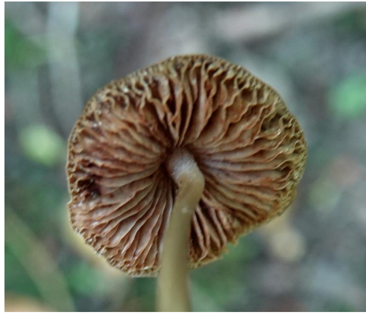
Mycena polygramma (Bull.) Gray, 1821 Mycène à pied strié - Tricholomatales - Mycenaceae