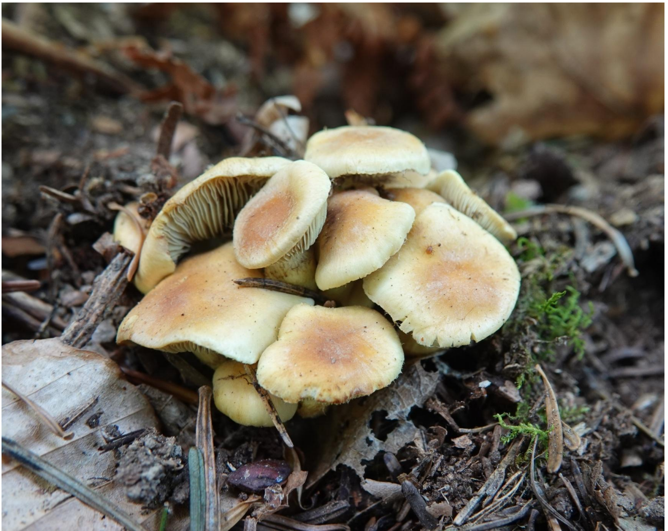
Hypholoma fasciculare (Huds.) P. Kumm., 1871 Hypholome en touffes - Hypholome fasciculé - Géophile Nématolome en touffes - Agaricales - Strophariaceae