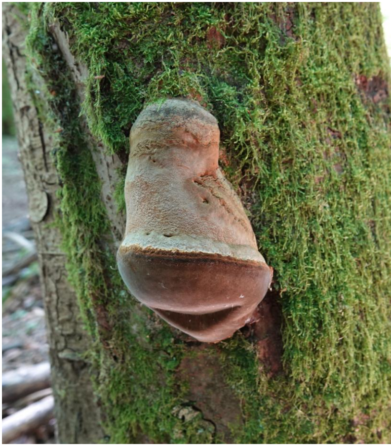
Phellinus hartigii (Allesch. & Schnabl) Pat., 1903 Polypore du sapin - Phellin de Hartig Hymenochaetales - Hymenochaetaceae