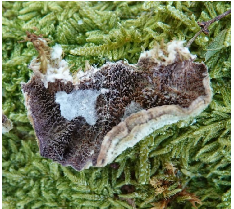
Trichaptum abietinum (Pers. ex J.F. Gmel.) Ryvardeen, 1972 Tramète lilas - Polyporales - Polyporaceae