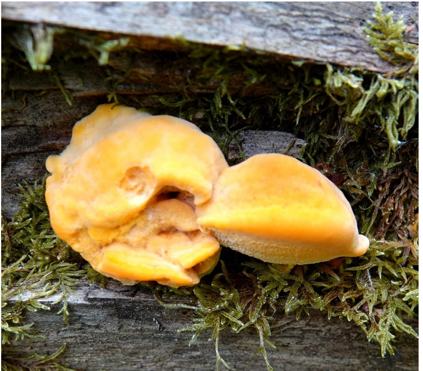
Hapalopilus croceus (Pers.) Donk, 1933 Polypore safran - Polyporales - Hapalopilaceae