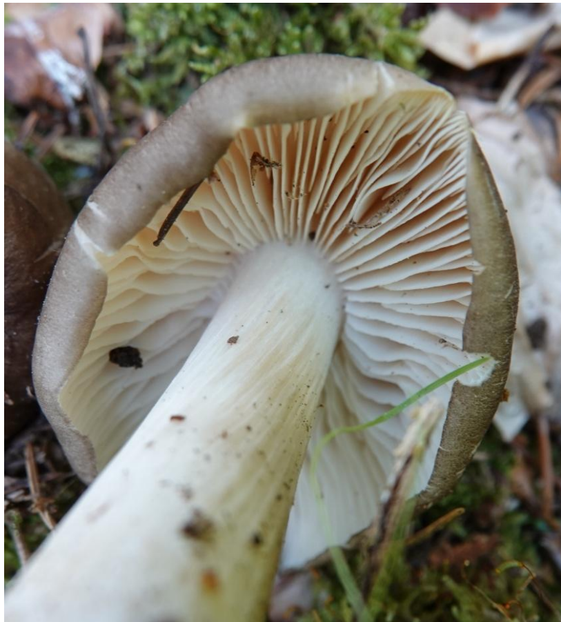
Megacollybia platyphylla (Pers.) Kotl. & Pouzar, 1972 Collybie à lames larges- Tricholomatales - Mycenaceae