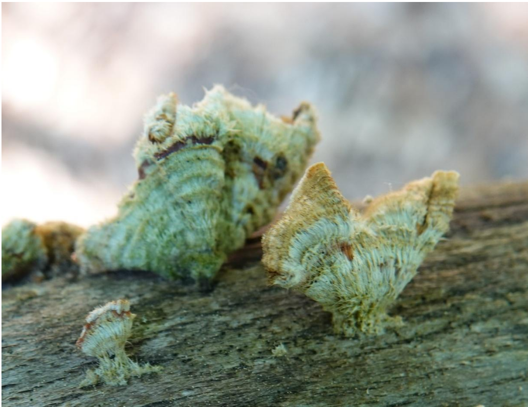
Stereum hirsutum (Willd.) Pers., 1800 Stérée hirsute - Polyporales - Stereaceae