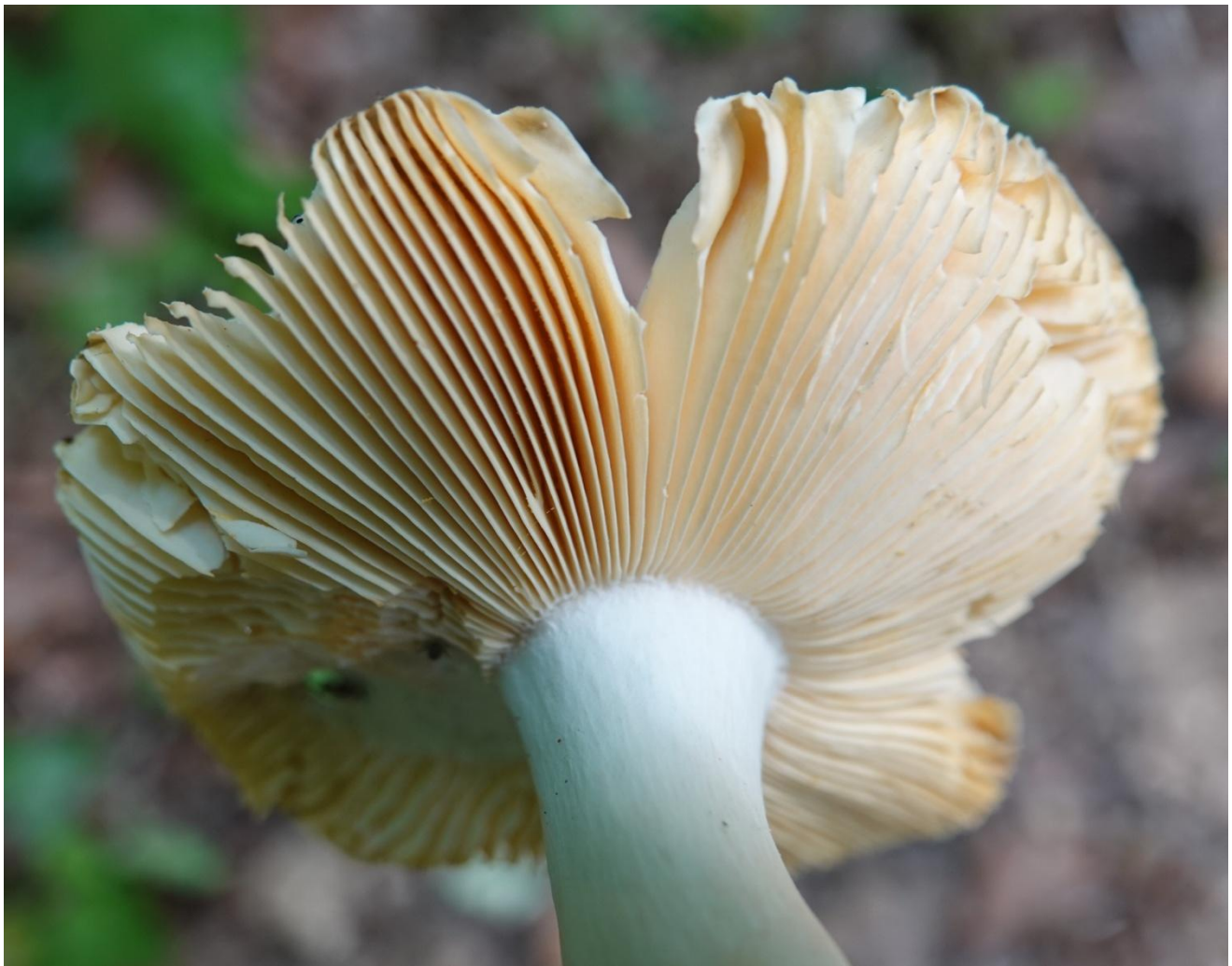
Russula carpini R. Girard & Heinem., 1956 Russule des charmes - Russulales - Russulaceae