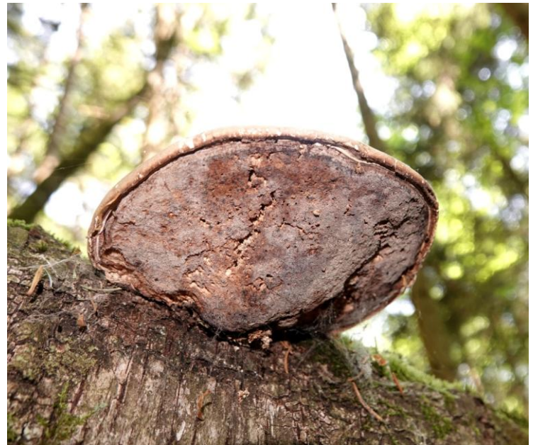
Piptoporus betulinus (Bull.) P. Karst., 1881 Polypore du bouleau - Polyporales - Fomitopsidaceae