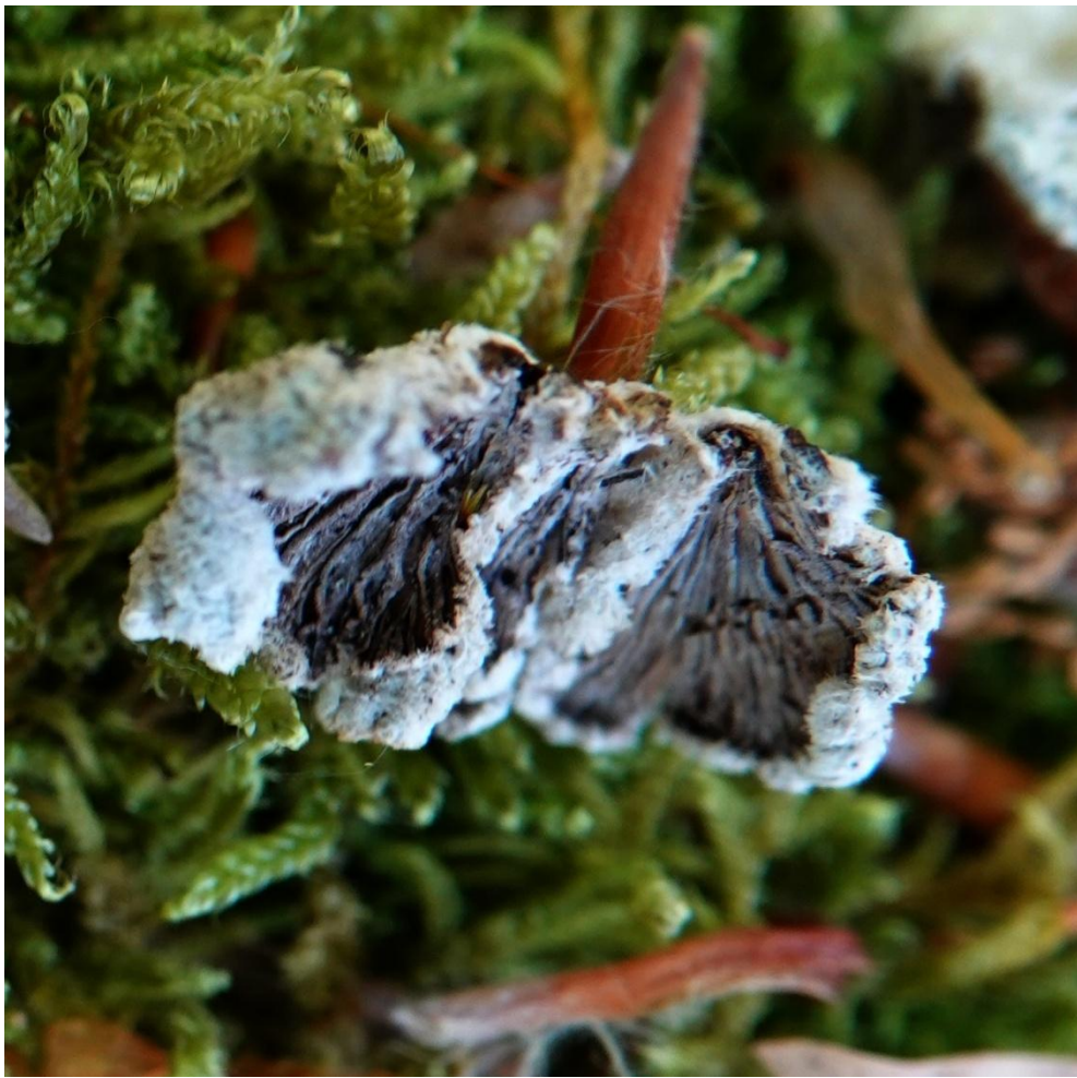
Schizophyllum commune Fr., 1815 Schizophylle commun - Schizophyllales - Schizophyllaceae