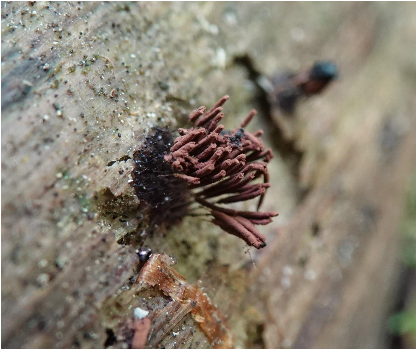
Stemonitis axifera (Bull.) T. Macbr., 1889 - Stemonitales - Stemonitidaceae