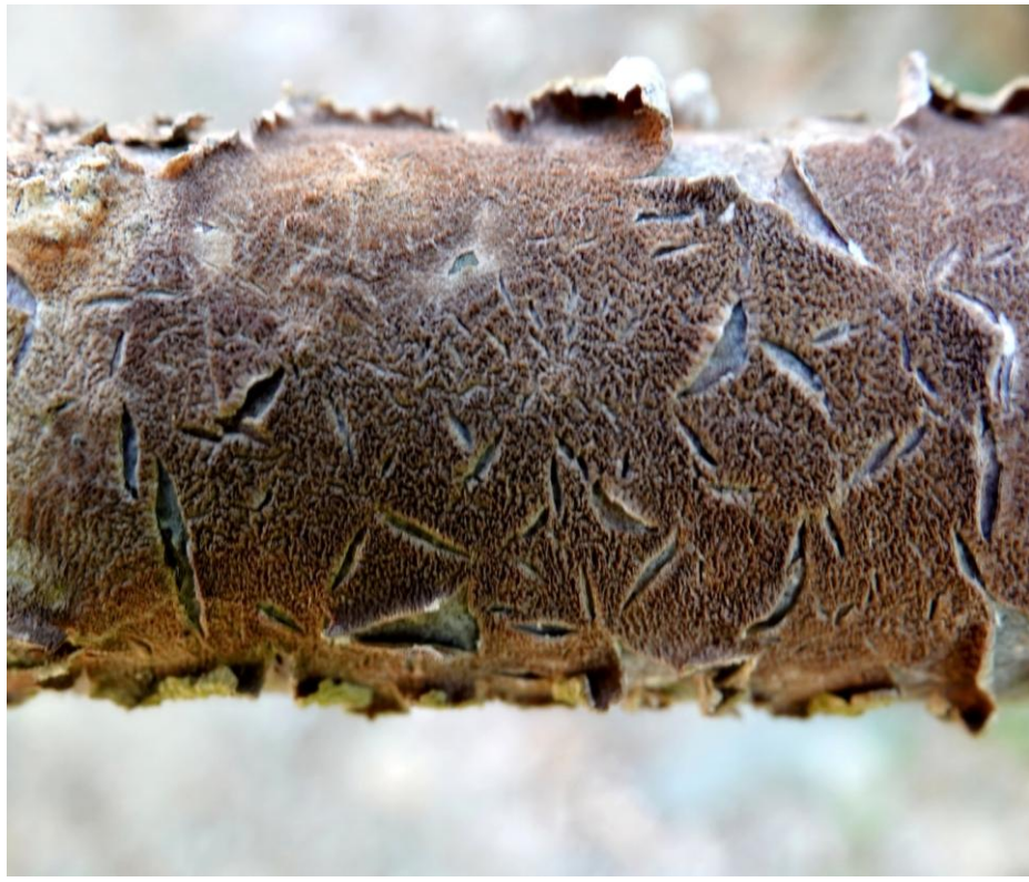
Trichaptum abietinum (Pers. ex J.F. Gmel.) Ryvardeen, 1972 Tramète lilas - Polyporales - Polyporaceae