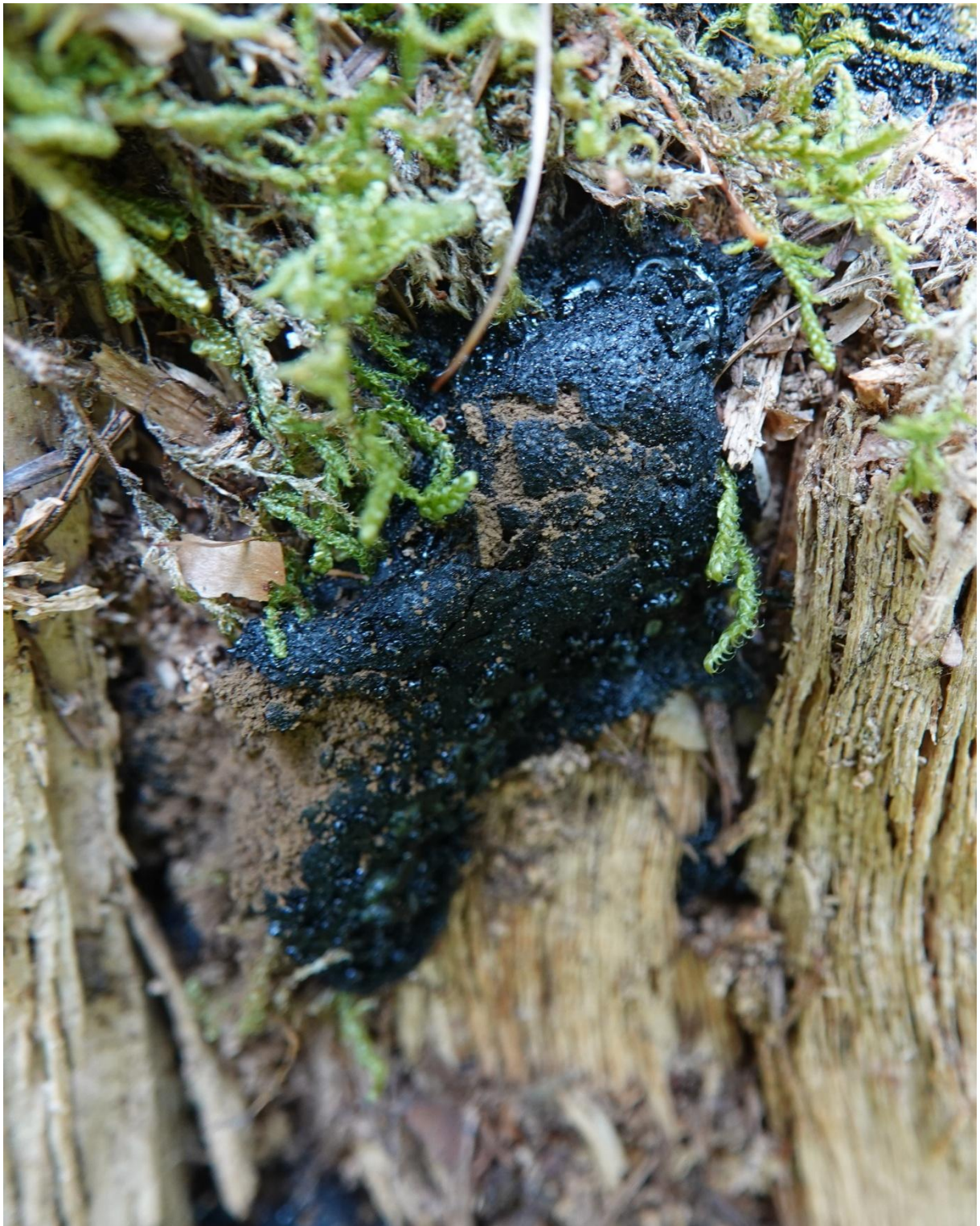
Tubifera ferruginosa (Batsch) J.F. Gmel., 1791 - Liceales - Reticulariaceae