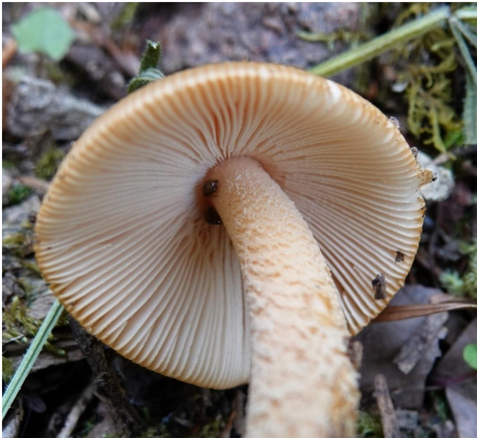
Amanita crocea (Quél.) Singer, 1951 Amanite safran - Amanitales - Amanitaceae