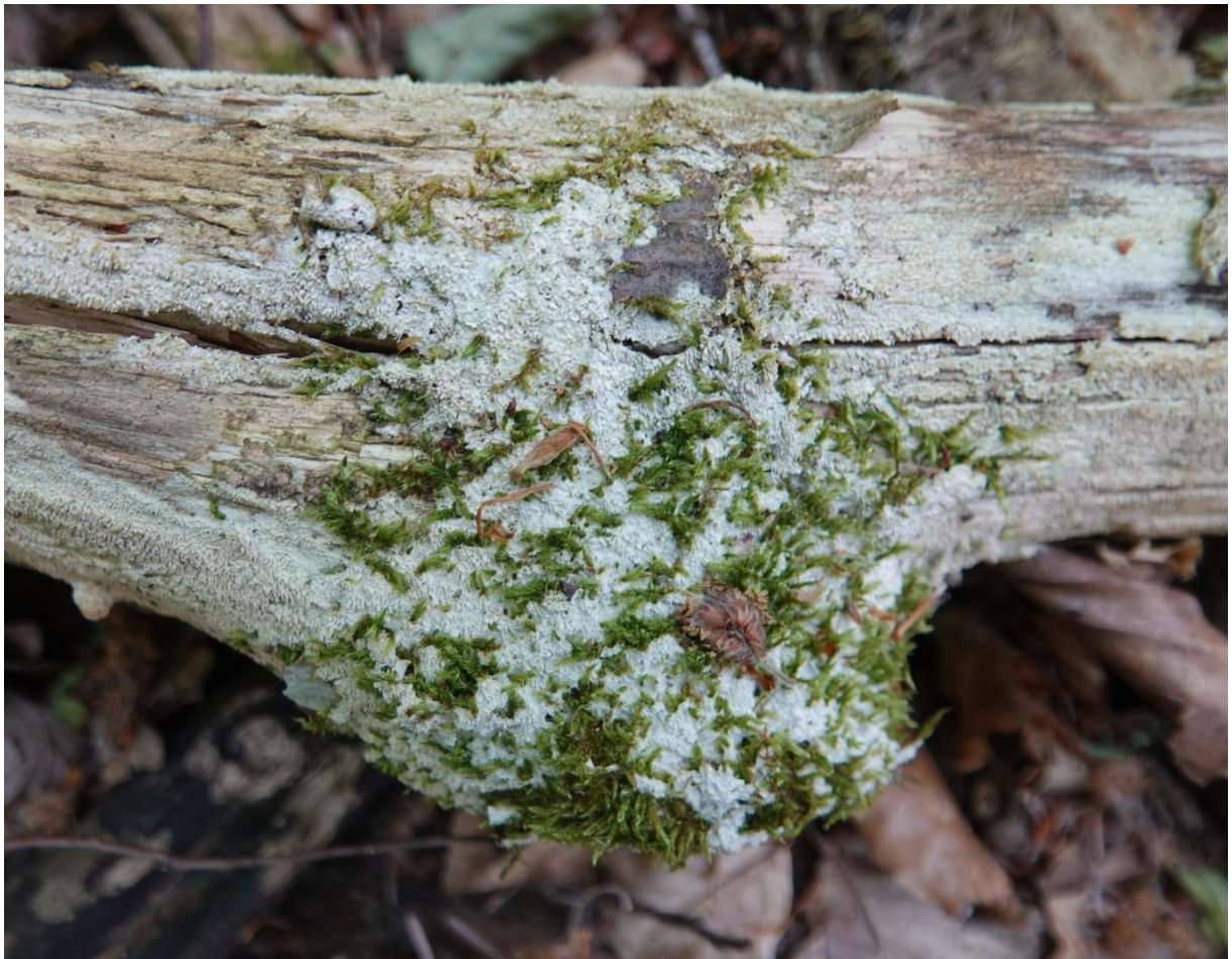
Schizopora paradoxa (Schrad.) Donk, 1967 Hymenochaetales - Schizoporaceae