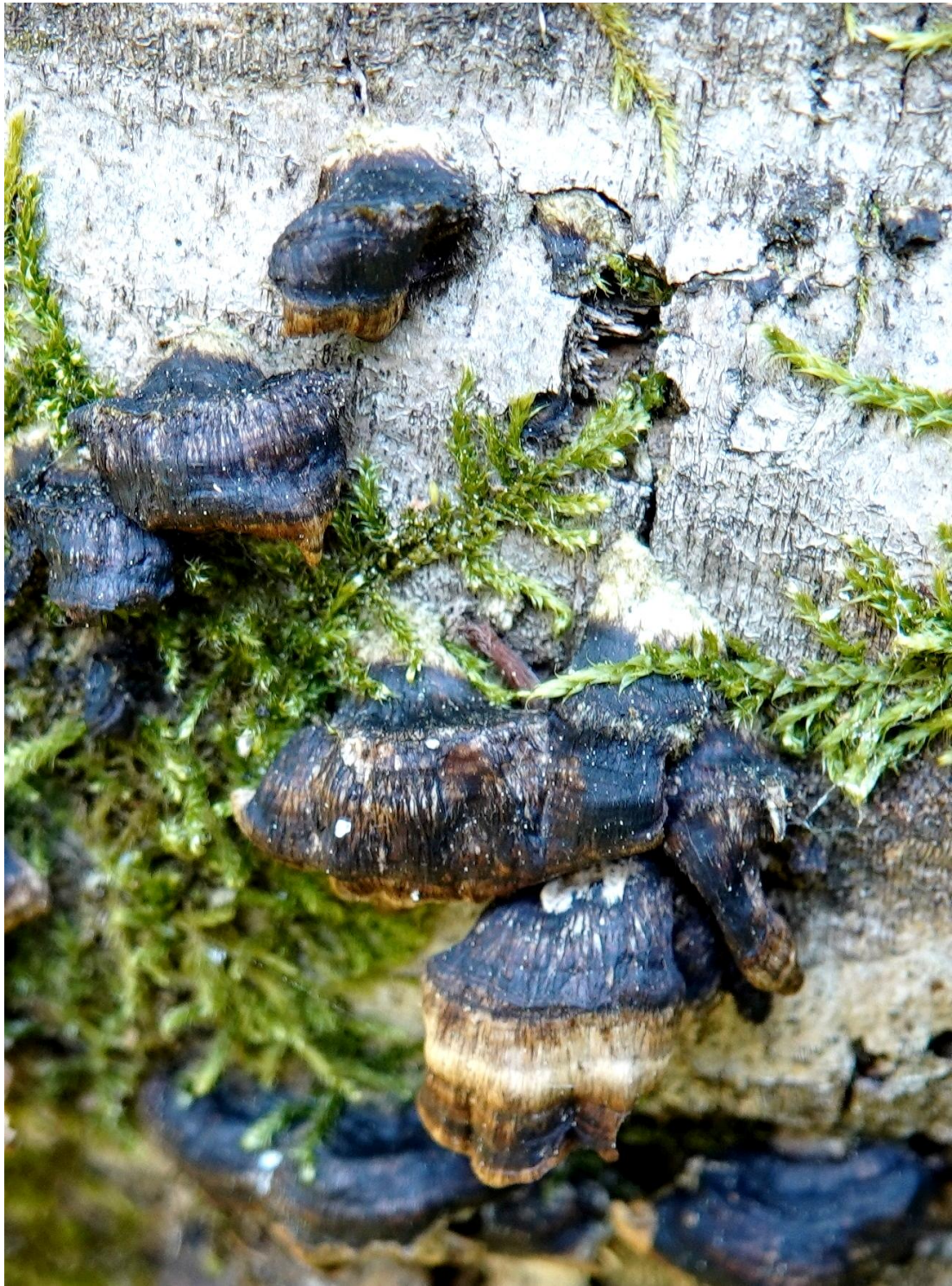
Bjerkandera adusta (Willd.) P. Karst., 1879 Tramète brûlée - Polyporales - Hapalopilaceae