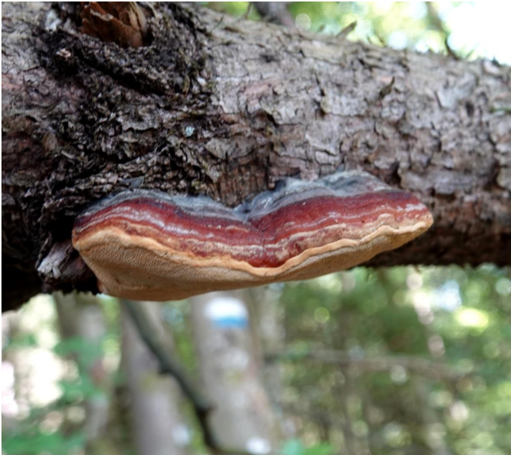
Fomitopsis pinicola (Sw.) P. Karst., 1881 Polypore marginé - Polyporales - Fomitopsidaceae