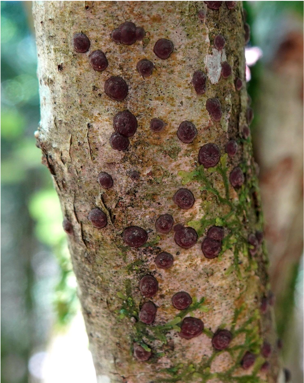
Hypoxylon fuscum (Pers.) Fr., 1849 - Xylariales - Xylariaceae