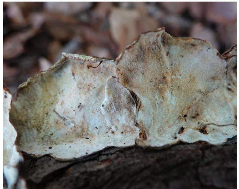
Trametes versicolor (L.) Lloyd, 1921 Tramète versicolore - Tramète à couleur changeante Polyporales - Polyporaceae