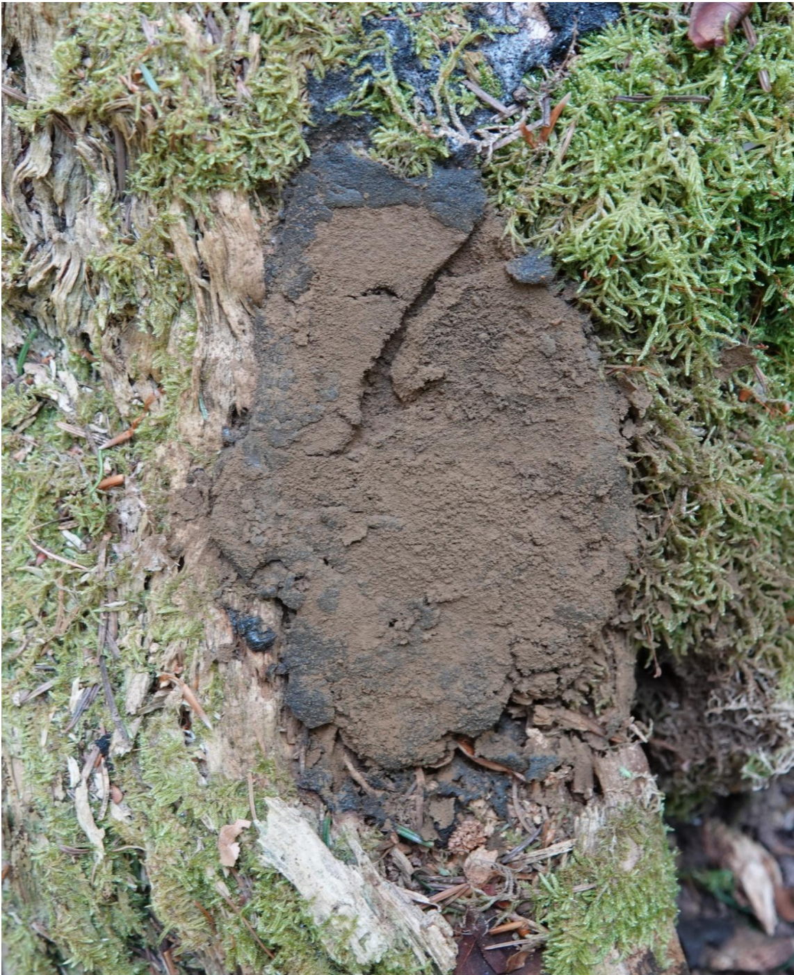
Tubifera ferruginosa (Batsch) J.F. Gmel., 1791 - Liceales - Reticulariaceae