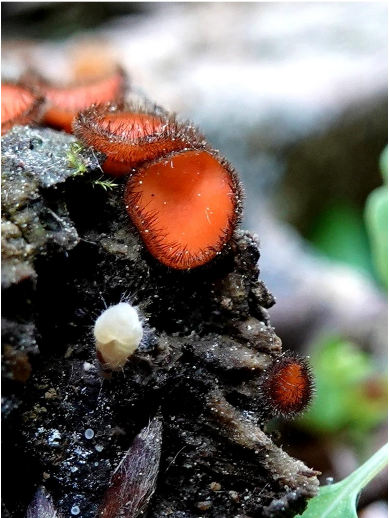
Scutellinia scutellata (L.) Lambotte, 1887 Pézize en bouclier - Pezizales - Pyronemataceae