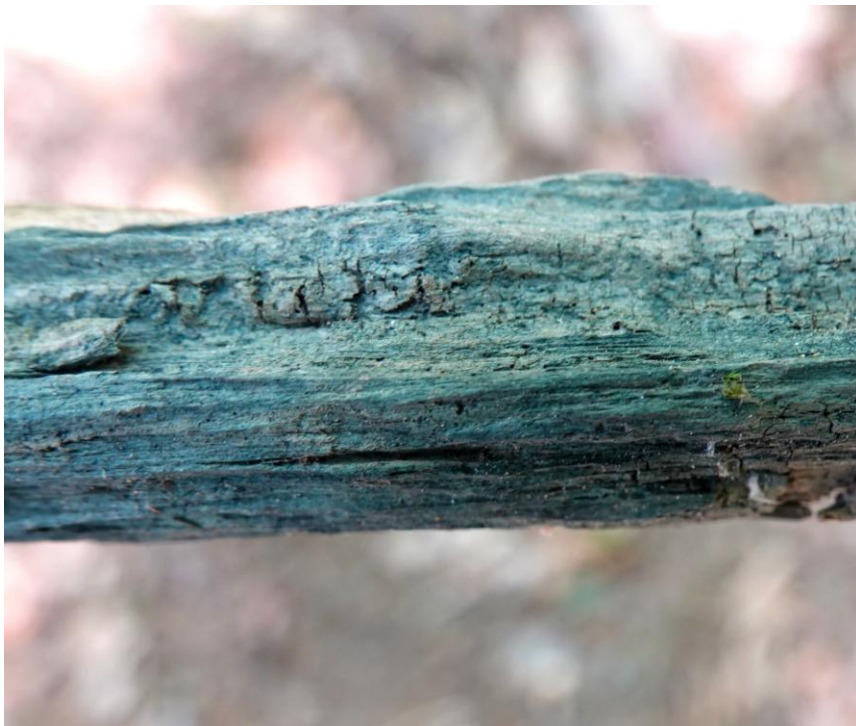
Chlorociboria aeruginascens (Nyl.) Kanouse ex C.S. Ramamurthi, Korf & L.R. Batra, 1958 Synonyme : Chlorosplenium aeruginascens (Nyl.) P. Karst., 1871 Helotiales - Helotiaceae