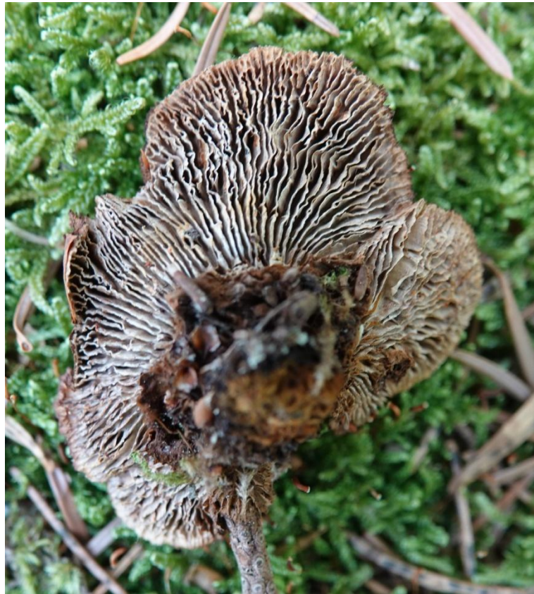
Gloeophyllum sepiarium (Wulfen) P. Karst., 1882 Lenzite des clôtures - Gloeophyllales - Gloeophyllaceae