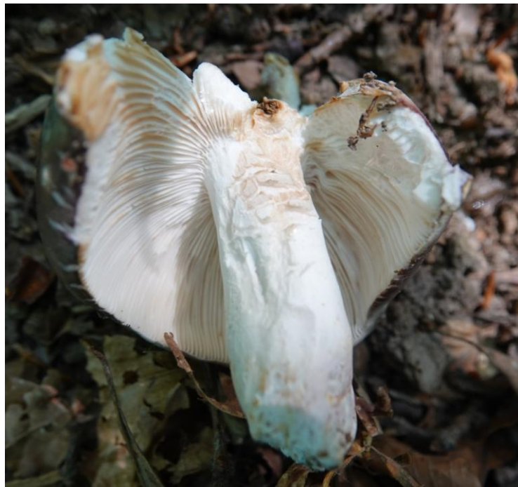
Russula cyanoxantha (Schaeff.) Fr., 1863 Russule charbonnière - Russulales - Russulaceae « Carrière CSA »