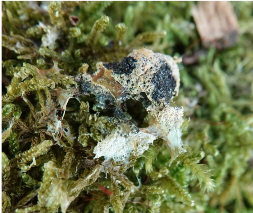
Fuligo septica (L.) F.H. Wigg., 1780 Fleur de tan - Physarales - Physaraceae