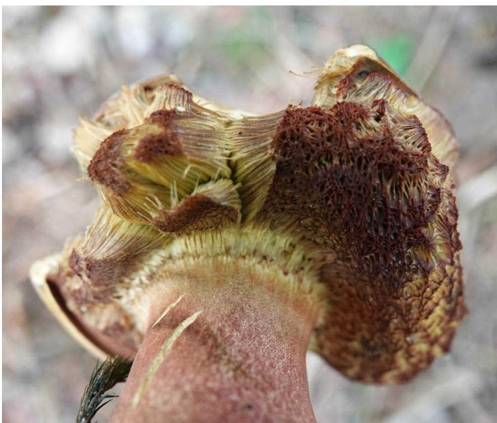
Neoboletus erythropus (Pers.) C. Hahn, 2015 Synonyme : Boletus erythropus Pers., 1796 Bolet à pied rouge - Boletales - Boletaceae