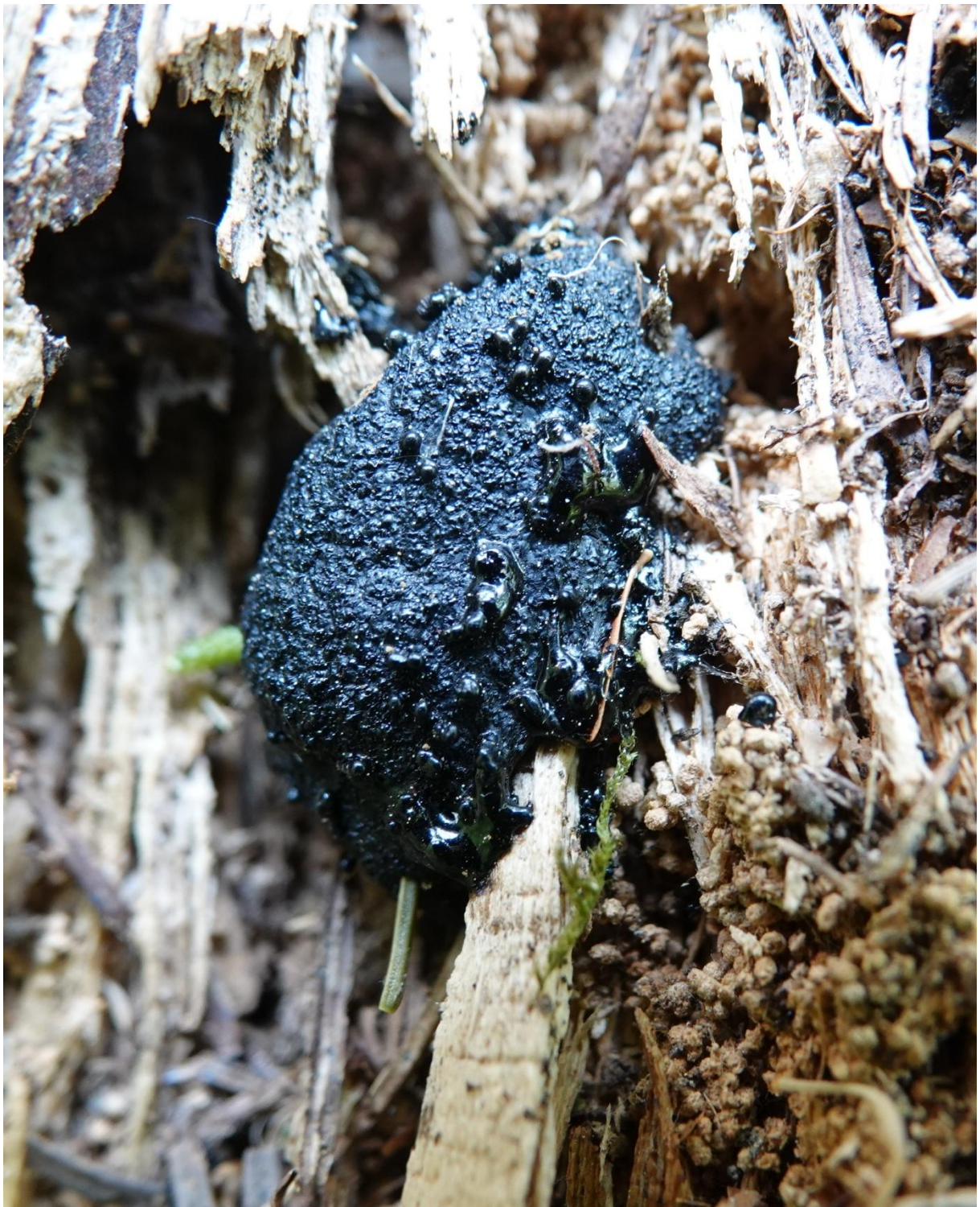
Tubifera ferruginosa (Batsch) J.F. Gmel., 1791 - Liceales - Reticulariaceae