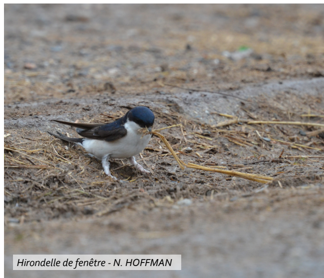
Hirondelle de fenêtre - N. HOFFMAN

Les chauves-souris sont les seuls mammifères capables de vol actif. Discrètes et nocturnes, petites et silencieuses, elles restent encore méconnues. Depuis 1976, toutes les espèces de chauves-souris sont protégées en France. Leur habitat est également protégé par la Directive européenne Habitats-Faune-Flore de 1992 et par l'arrêté ministériel du 23 avril 2007.