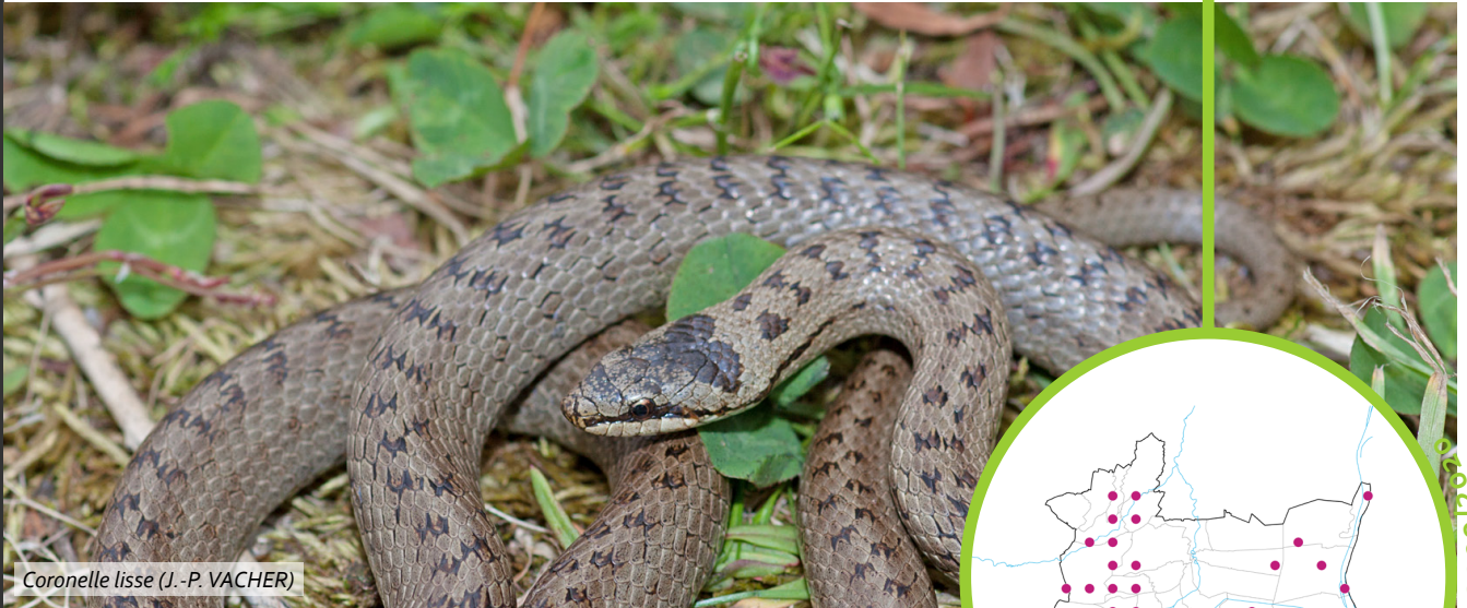
Coronelle lisse (J.-P. VACHER)