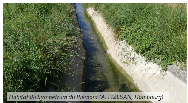
Habitat du Sympetrum du Piémont (A. FIZESAN, Hombourg)

La gestion des fossés et canaux doit permettre à ce que s'établisse une végétation aquatique naturelle et spontanée dans le lit et les berges. Aussi, la végétation des bandes enherbées adjacentes ne doit pas être fauchée en été, pendant la période d'émergence.