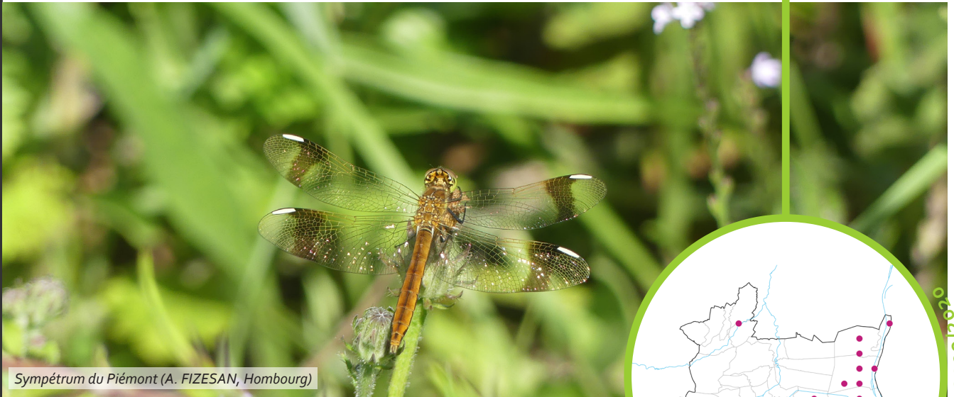
Sympetrum du Piémont (A. FIZESAN, Hombourg)