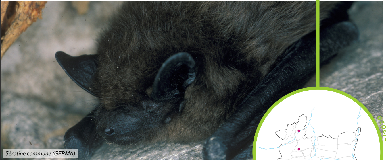
Sérotine commune (GEPMA)