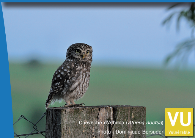
Chevêche d'Athéna ( Athena noctua )